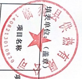
运城市政府专项债券项目进展情况表